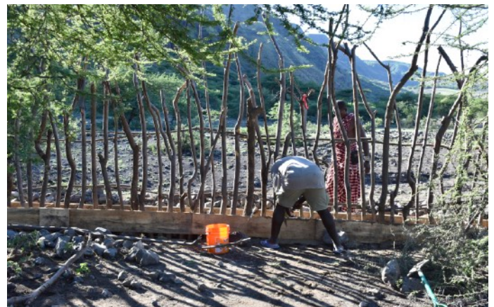
Abb. 5: Errichten des Naturzauns beim Projekthaus in Naiborgosso.