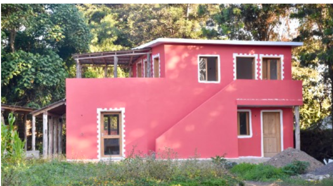
Abb.1: Fertig errichtetes Bürogebäude.

Leider mussten wir uns dieses Jahr auch mit dem Thema von Diebstählen befassen. Abhanden kamen vorwiegend Baumaterialien, wie Zement und Holz, aber auch Werkzeuge. Einen Teil der Wiederbeschaffungskosten wurde von der einen Handwerkergruppe getragen, den Rest mussten wir selbst decken.