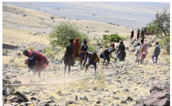
Abb. 6: Ausheben des Grabens für die Verlegung der Wasserleitung.