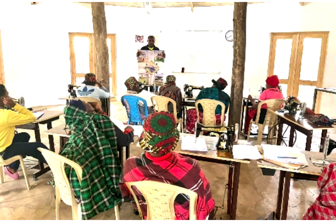
Abb.4: Unterricht in Businessplanung und Risikomanagement im 2. Semester.

Um den Schülerinnen hochstehendes und Kontext bezogenes Fachwissen vermitteln zu können, haben wir lokales Lehrpersonal aus unterschiedlichen Fachrichtungen angestellt. Gesamthaft unterrichten acht Lehrpersonen an der Schneiderinnenschule mit Abschlüssen in folgenden Disziplinen: Nähen (Accessoires, Kleidung, Leder, Glasperlen), Design, Ökonomie, Persönliche Entwicklung und Medizin.