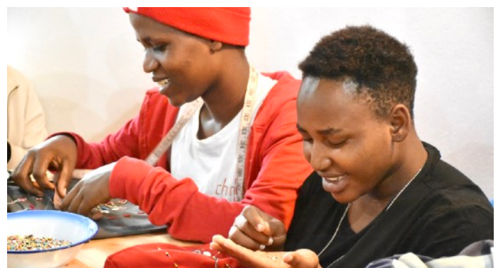
Abb. 2: Schülerin Sion und Tumaini beim Besticken von kleinen Tragtaschen mit Glasperlen im 1. Semester.

Im zweiten Semester vertiefen die Schülerinnen ihre Kenntnisse, wobei sie komplexere Produkte nähen und sich mit Fragen bezüglich verschiedenen Designs, Materialien und Techniken befassen. Ausserdem besuchen sie Blockkurse zu den Themen Ökonomie mit Schwerpunkt in Betriebswirtschaft, Gesundheit und Familienplanung sowie zu lebenspraktischen Themen (s. Abb. 4).