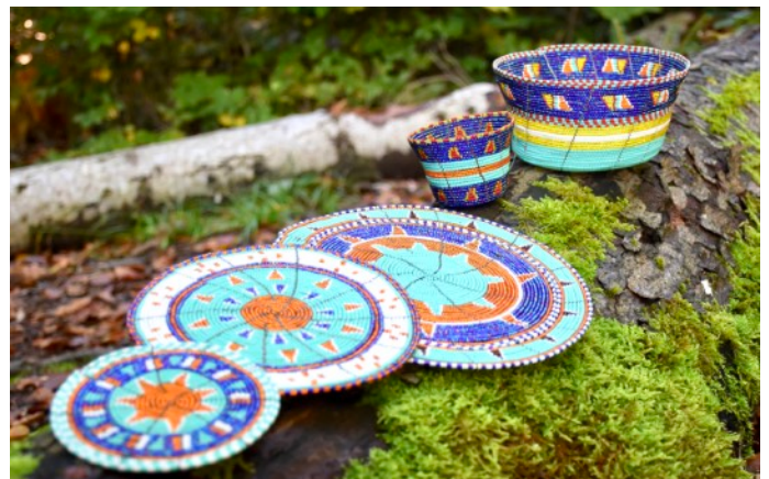
Abb. 8: Neukreationen im Farbton Türkis.

Vor einiger Zeit berichtete der Verein, dass er sich für die Landrechte der Frauen in Naiborgosso einsetzt, wobei die Ländereien im nationalen Grundbuch eingetragen wurden. Leider konnten die Landtitel aufgrund fehlerhaft ausgestellten Zertifikate den Frauen noch nicht überreicht werden. Die Vereinsmitarbeitenden bemühen sich, damit die verantwortlichen Behörden die Landtitel bald möglichst richtig ausstellen.