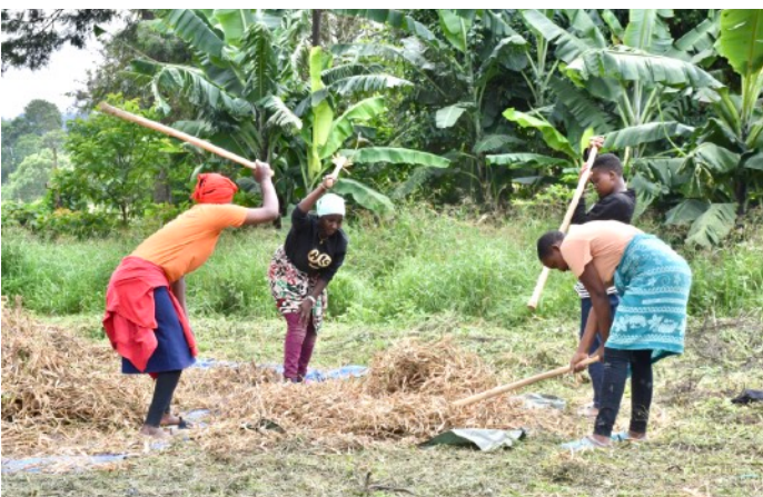
Abb.5: Schülerinnen beim Schlagen der Bohnenernte im August 2025.

Um den Schülerinnen hochstehendes und Kontext bezogenes Fachwissen vermitteln zu können, haben wir lokales Lehrpersonal aus unterschiedlichen Fachrichtungen angestellt. Gesamthaft unterrichten acht Lehrpersonen an der Schneiderinnenschule mit Abschlüssen in folgenden Disziplinen: Nähen (Accessoires, Kleidung, Leder, Glasperlen), Design, Ökonomie, Persönliche Entwicklung und Medizin.